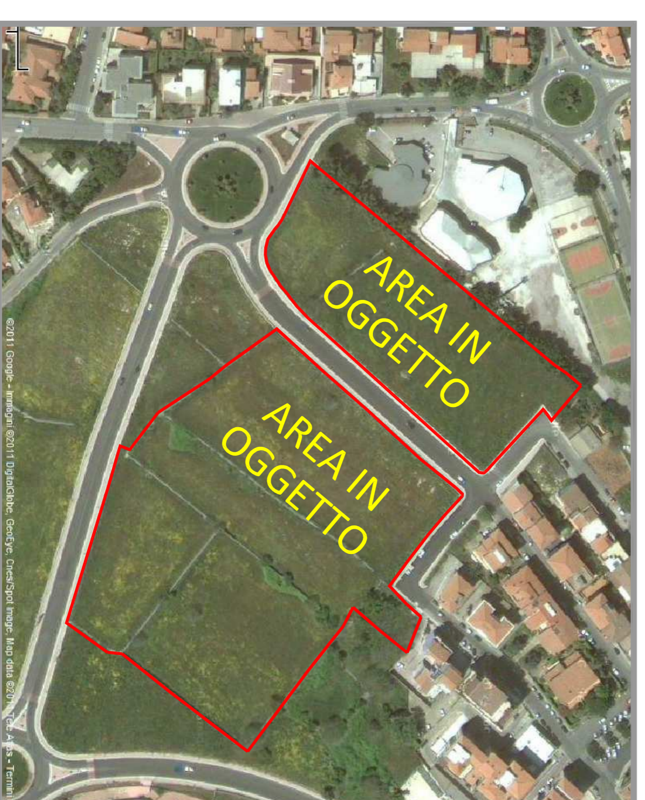
A-FOTO AEREA - STATO ATTUALE - SCALA 1:2000